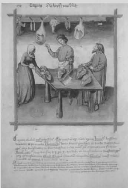
Fig. 1. El mercader de carn de cabra. Tacuinum Sanitatis. Segle XV. BNF, département des manuscrits, latin 9333, fol. 24r

En la present comunicació s'estudia el conjunt arqueofaunístic provinent de l'excavació arqueològica efectuada durant els mesos d'abril i maig de 1998 1 , al solar situat al carrer de la Borriana, 14. Aquest solar dona a llevant del passeig de la plaça Major, on s'instal·là el mercat fins al 1930, any en què va ser traslladada l'activitat comercial a una nova plaça de mercat coberta.