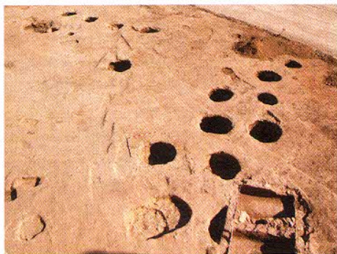
Vista de conjunt d'una part de l'assentament amb el lacus i les sitges de l'antiguitat tardana.