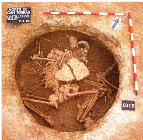
Estructura 11, sitja reutilitzada com a lloc d'enterrament simultani de quatre individus del Neolític mitjà. S'hi observen algunes pedres situades directament damunt dels esquelets que formaven part del nivell de pedres (UE32) que segellava l'estructura.

El material procedent dels seus estrats de rebliment, força escàs, es redueix únicament a la presència de restes d'argila cuita i de ceràmica a mà amb cordons llisos aplicats en relleu, corresponent a grans recipients de tipus tenalla o grans vasos contenidors. Aquest tipus de material permet proposar una datació dins del període neolític sense poder especificar res més, ara com ara, fins que no se'n disposi d'un l'estudi detallat i se n'hagin efectuat datacions de carboni 14.